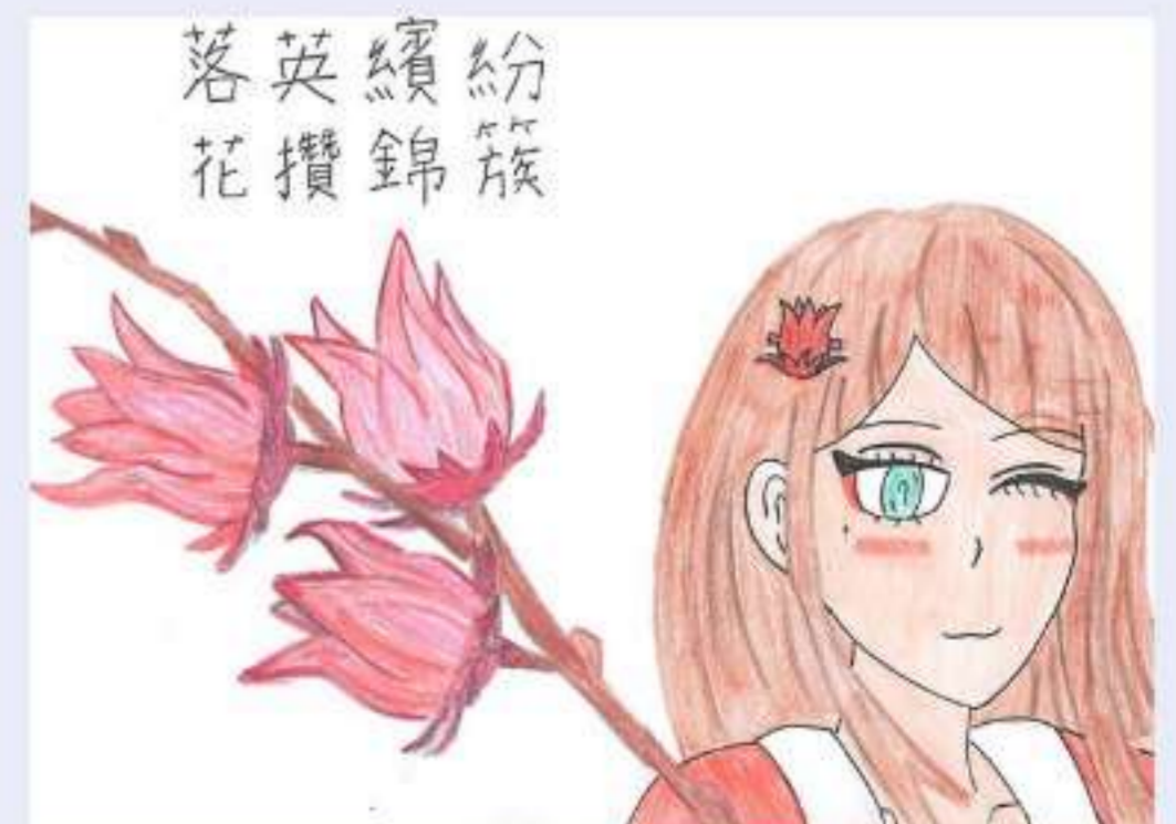
落英繽紛 花攢錦簇