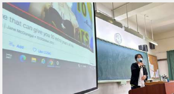
點擊圖片看完整講稿