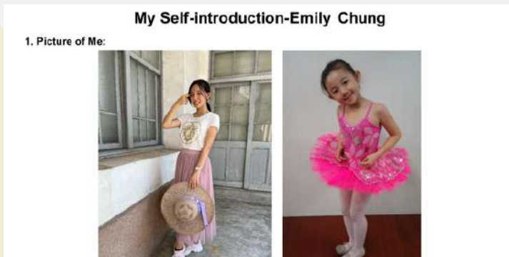
點擊圖片看完整講稿

這是我高中第一次上台用英文發表，事前我已經上網查了不少自我介紹的技巧，還特地寫稿避免文法錯誤，甚至在家裡練習超過 10 次，只為了降低緊張感。但當我看到其他同學的精彩表現時，還是忍不住感到壓力倍增，甚至有點自慚形穢。輪到我上台時，看見台下同學專注聆聽的模樣，我告訴自己不能退縮，努力整理腦海中的句子，雖然中間有些忘詞，但最後還是順利完成了自我介紹，為我的英文表達邁出了重要的一步。