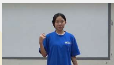
點擊圖片看練習影片