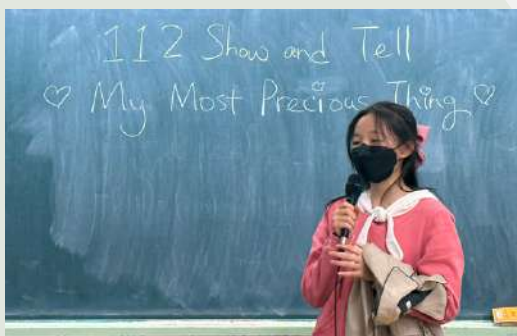
點擊圖片看我的報告影片

這次的發表需要結合說明與抒情，來闡述這件「風衣」它對我的情感連結。我照舊先寫好講稿，並在家練習了好幾次，不過有了之前的經驗，這次的表達比以往更流暢，也更自然。我開始加入肢體動作和眼神交流，也減少了因為忘詞而尷尬笑場的情況。這次的練習讓我運用大綱來聚焦重點，也讓我發現，好的表達不只是講清楚物品的功能，而是加上自己的情感，讓故事更具感染力。