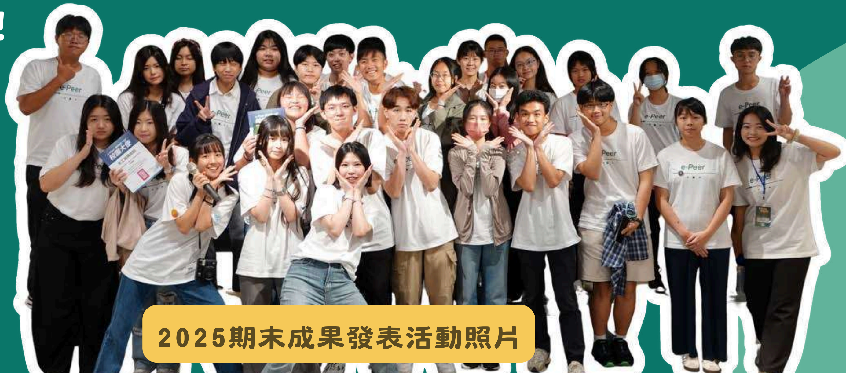
2025 期末成果發表活動照片

慧治教育協會每年都會招募一群高中職同學擔任 e-Peer 校園大使，去年首次招收大專院校同學，透過跨校、跨年齡交流、增能培訓課程與任務實作，讓同學們適性探索自我潛能，從中發現更好的自己！