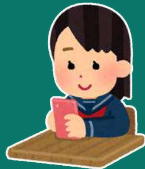
積極參與群組討論