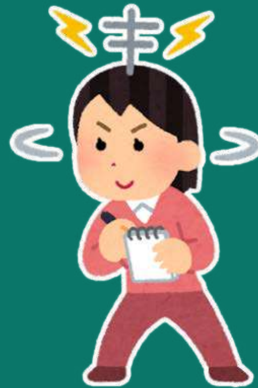
完成每月指定任務