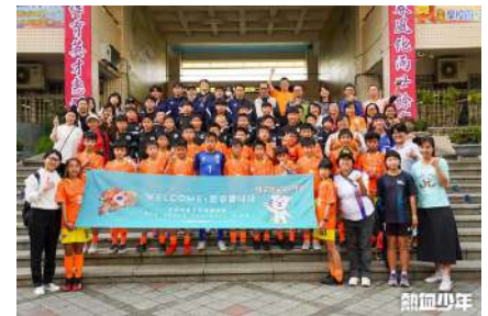
國安國小、韓國球隊合影