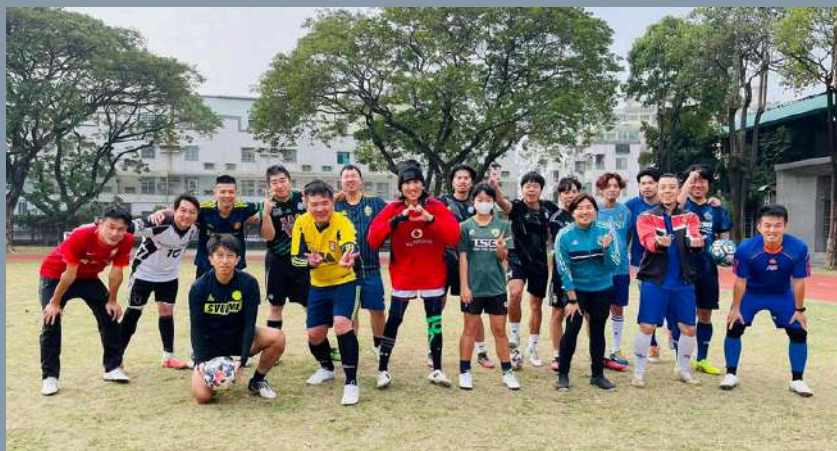
北屋足球聯合隊2023新春合影

剛復原的腳雖然可以碰球，但是訓練需要循序漸進，因此我先與訓練強度較低的球隊踢球。