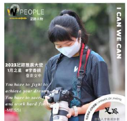
推廣大使獨立介紹