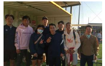
韓國教練團、球員合影