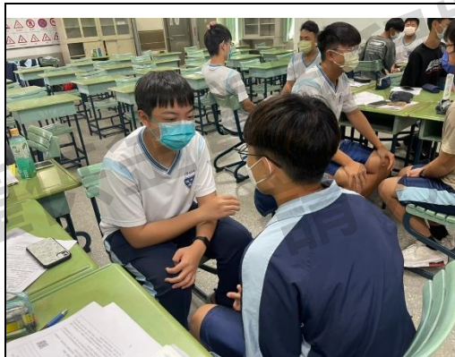
圖一：兩兩對坐練習

接著有長達十週進行理論課程，是整學期課程中最核心的部分。這段時間內，老師從自信表達、主持腦一路講到主持素養，有著主持活動的種種細節。對我來說，印象最深刻的是主持素養，內容包含了語詞、語音、聲情、台風等四大主題，每一主題都至少會花一周的時間進行。這段時間的內容，雖說以主持為名，但其實絲毫不局限於「主持」這樣的單一場合，而是在各種口語表達時皆能夠學以致用。