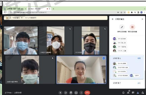
圖二：帶領小組進行組內發表 (線上上課，筆者為左上者)