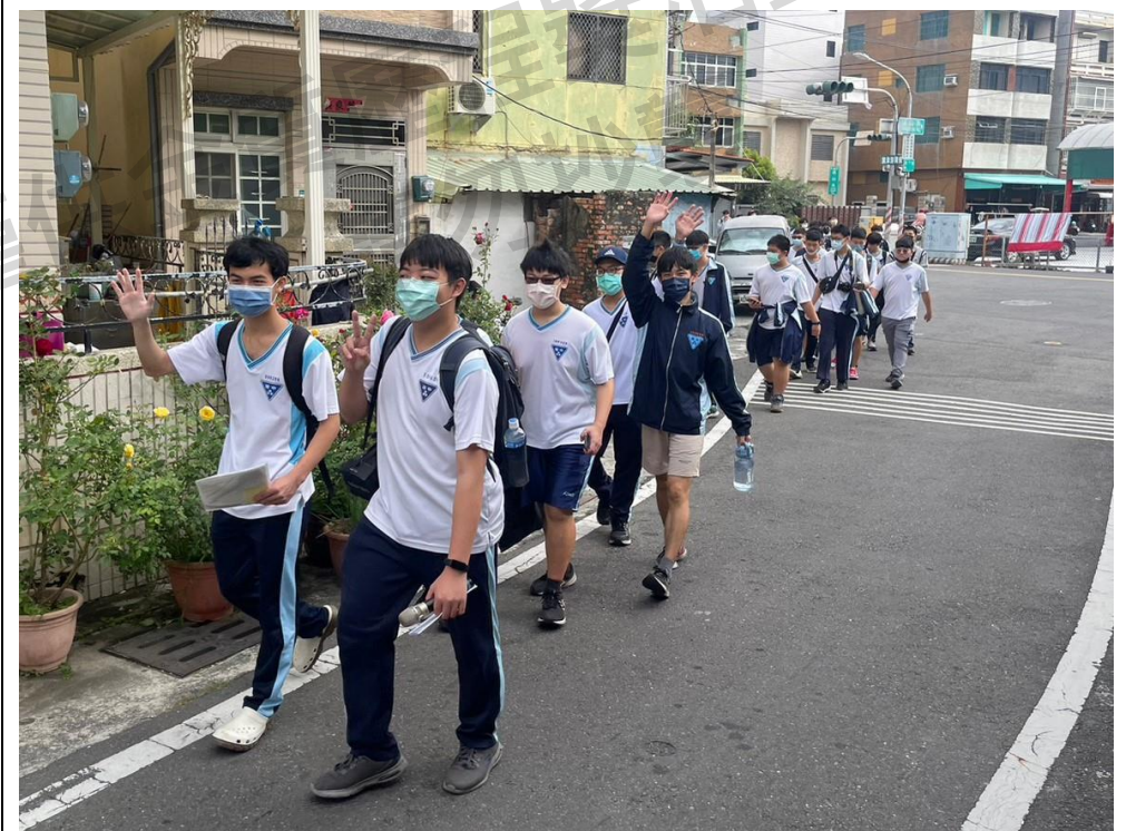
圖十四：帶隊於旗津步行（筆者為第一排綠口罩者）