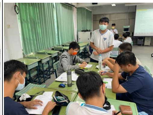
圖四：小組內發表(二)