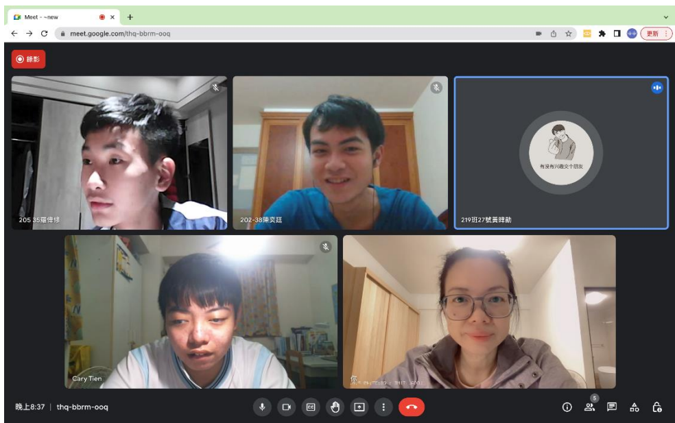
圖十二：線上討論（筆者為左下角者）