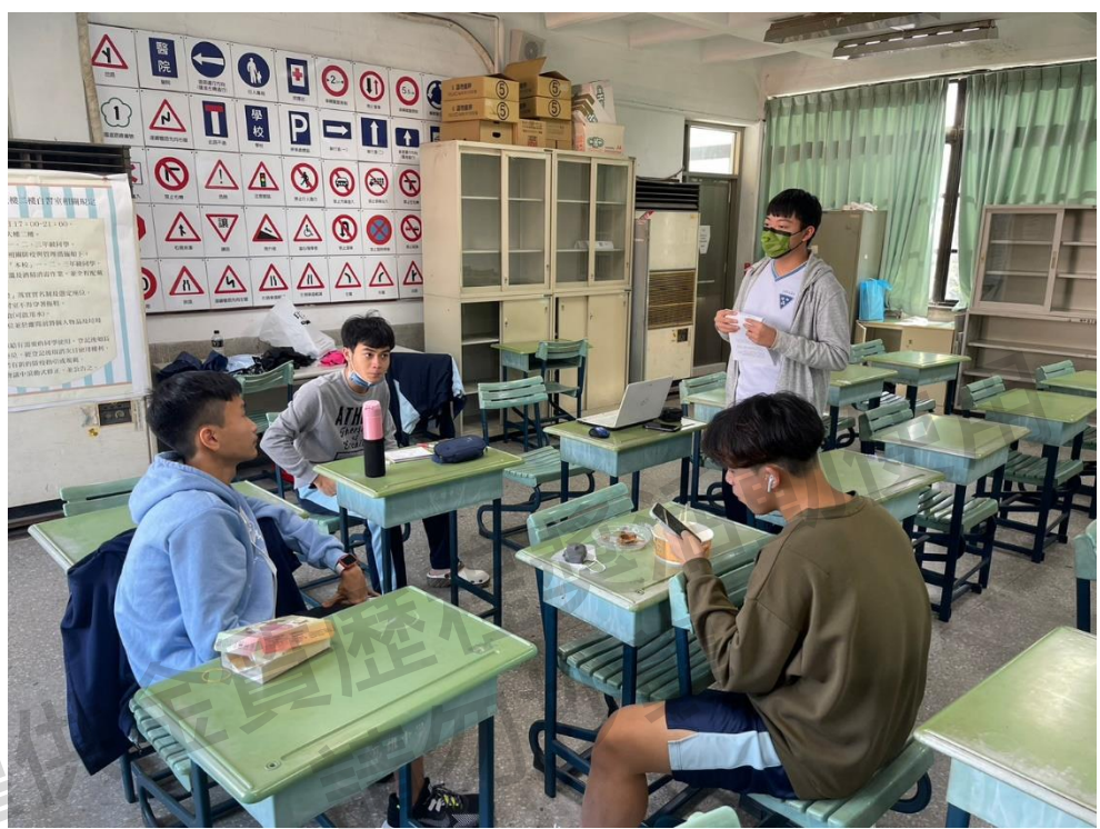
圖十一：於學校進行會議（筆者為站立者）

完成場勘後，由於緊接著就是期中考，因此我們決議先將場勘結果簡單紀錄，等到考試後再來進行通盤的檢討與改善。在考完試至出發的短短兩週內，我們經歷了多次的線上、實體討論，總算敲定了當天的所有細項。此外，也在各次會議中，讓大家練習自己所撰寫的解說稿，確保活動當天能夠順暢進行。