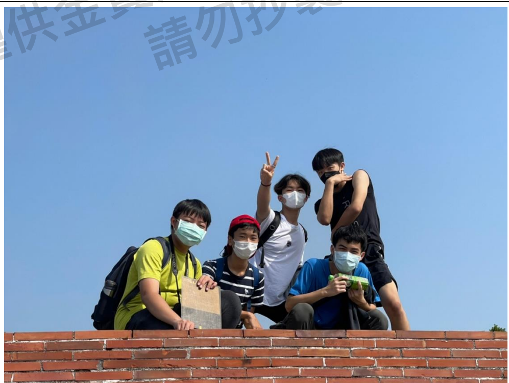
圖十：場勘時組員合影留念（於旗後砲台，筆者為左一）

約莫在籌備開始後的一個月，我們選定了一個週六上午到旗津進行現場場勘。當天除了確認各自的工作分配外，也看完了各式各樣的大小問題，包含集合地點、解說地點、行走路線等。由於當時的我們彼此間已經比較熟識，整體來說當天的氛圍是頗愉快的，也很有效率地完成了所有場勘任務。