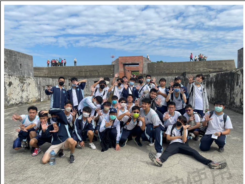
圖十三：全體同學於旗後砲台合照（筆者為前排右一）