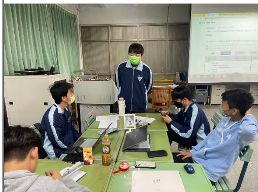
圖三：小組內發表(一)