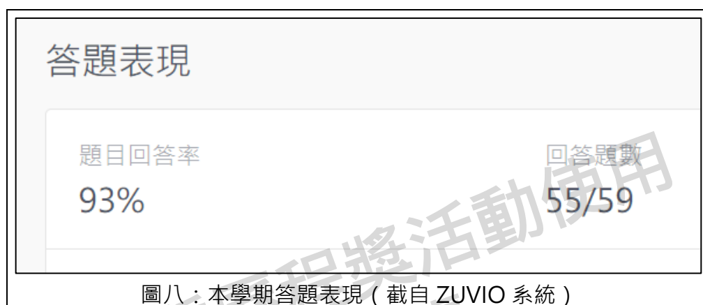
圖八：本學期答題表現

一般而言，老師會在上課前就將當天的題目設定好，等待講到有題目時才開放作答，時間到後就關閉題目不再開放作答。而我們在系統上回答的題目，多數是需要思考的問答題，或者是組內短講的講稿。在這學期的所有題目中，我回答了大約 93%的題目。